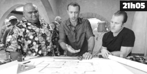
McGarrett reprend du service et le 5-0, fait équipe avec un agent de la DEA dans l'espoir de retrouver un tueur.