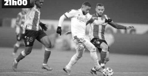
Football. Ligue 1 Uber Eats. 31 e journée.