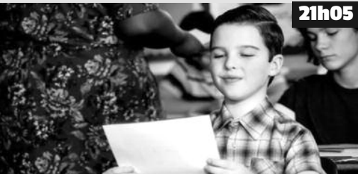
En grandissant, Sheldon ne perd rien de son intelligence redoutable et de son caractère sceptique.