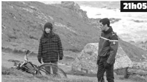
Au pied de la Pointe du Raz, le corps d'une vieille femme est retrouvé échoué sur la plage.