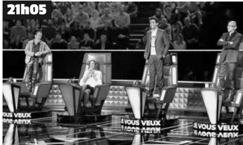
Deuxième soirée de Battles de la saison. À la fin de l'épreuve, le coach qualifiera un talent pour l'étape des K.O.