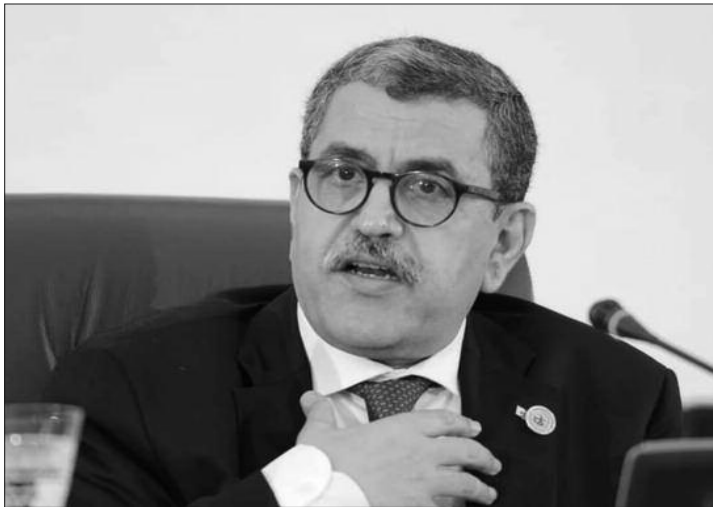
plan national de certification et de signature électroniques, énoncés dans les dispositions de la loi 15-04 du 1 février 2015 fixant les règles générales de certification et de signature électroniques.

Organisée par le ministère de la Poste et des Télécommunications au Centre international des conférences (CIC) "Abdellatif Rahal", en présence de plusieurs membres du Gouvernement et de représentants d'organes et d'institutions de l'Etat, cette manifestation s'inscrit dans la droite ligne de la stratégie intégrée, adoptée par le gouvernement en vue d'accélérer la modernisation de l'activité administrative et l'optimisation des performances des services publics, en se basant sur les avantages des technologies de l'information et de la communication (TIC) et les facilitations en matière de simplification et d'amélioration des procédures administratives. Les efforts consentis par le Gouvernement dans ce sens visent à intégrer l'Algérie dans la société de l'information au niveau mondial, à travers le développement du contenu numérique algérien, ainsi qu'à être au diapason de l'économie basée sur le savoir et la connaissance, en instaurant un climat propice à l'émergence d'un réseau élargi de startups en matière d'innovation. Il est à noter que la programmation de cet événement se veut le couronnement d'un processus technologique harmonieux conduit par des cadres nationaux hautement compétents, en collaboration et en coordination avec d'éminents experts étrangers en vue de la concrétisation des axes du