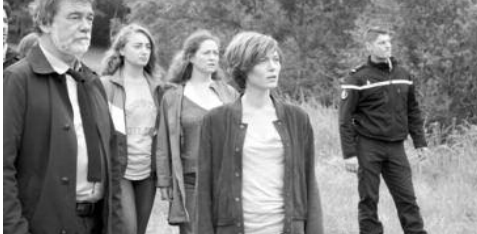
Le commissaire Pierre Niémans est appelé en pleine nuit par Marek Volsnic, un ancien braqueur. Paniqué, le détenu raccroche.

Après le succès musical, Dua Lipa se prépare à devenir actrice