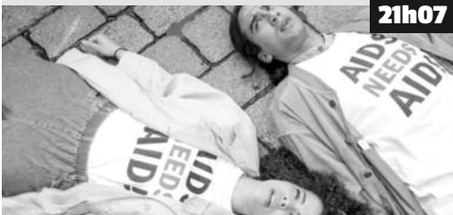
Mars 1988. Les enterrements se multiplient.