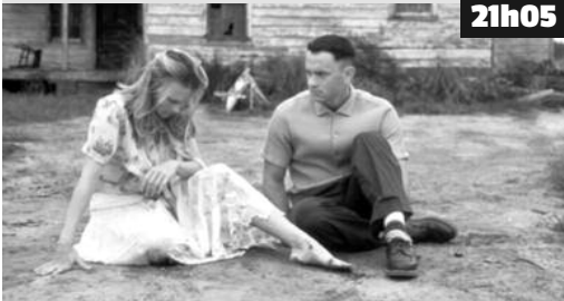
Forrest Gump, assis sur un banc public, raconte sa vie à des badauds.