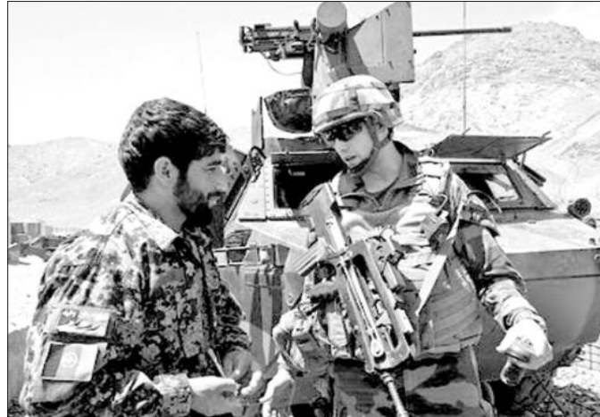
mandes resteraient jusqu'au 31 janvier 2022. L'Allemagne a le deuxième plus important contingent, après celui des Etats-Unis, dans la Mission Resolute Support (Mission Sou-

S'exprimant lors d'une conférence de presse à Kaboul, un jour après que les talibans aient averti les Etats-Unis contre une prolongation de la présence militaire au-delà de la date limite du 1er mai, conformément à l'accord de Doha au Qatar, le conseiller afghan pour la sécurité nationale, Hamdullah Mohib, a déclaré que "le retrait précipité des troupes étrangères d'Afghanistan présentait un risque". Ses déclarations font suite à un article du New York Times selon lequel les services de renseignement américains ont indiqué à l'administration Biden que les talibans pourraient "envahir la majeure partie de l'Afghanistan d'ici deux à trois ans si les troupes américaines quittent le pays avant qu'un accord de partage du pouvoir ne soit conclu entre les parties au conflit". Les Talibans ont réagi, vendredi, aux récentes déclarations du président américain Joe Biden, ainsi qu'à la prolongation de la présence des troupes allemandes dans ce pays ravagé par la guerre. Cette déclaration intervient alors que l'Allemagne a accepté de prolonger sa mission en Afghanistan jusqu'en 2022, sous réserve de l'approbation du Parlement. Selon le projet approuvé par le cabinet de la chancelière Angela Merkel, les troupes alle-