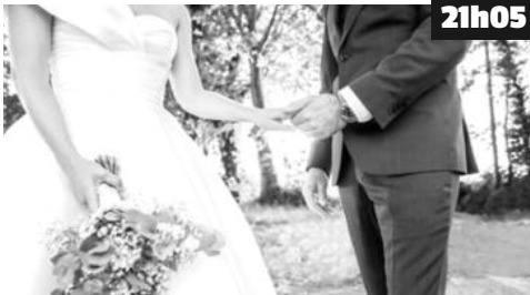
Des célibataires participent à une expérience sur la compatibilité amoureuse.