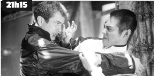
Après moult missions, Martin Riggs et Roger Murtaugh sont unis par une solide amitié. Le premier va être père, le second grand-père.