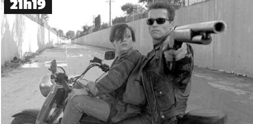
En 2029, John Connor s'apprête à lancer l'assaut final contre Skynet et les machines.