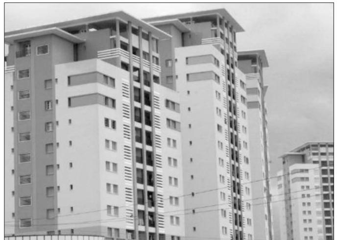
sions installées par le ministère, M. Zitouni a fait état de l'autorisation à des représentants de souscripteurs d'inspecter les logements et

Cette opération concerne les souscripteurs de 33 wilayas, a déclaré à la presse M. Zitouni faisant état de la mise en ligne, dans les prochains jours, des ordres de paiement de la troisième tranche pour les souscripteurs ayant retiré leurs décisions d'affectation. Expliquant le retard accusé dans cette opération "par le taux d'avancement des travaux qui doit dépasser les 70% pour pouvoir délivrer les décisions d'affectation", le même responsable a indiqué que l'Agence "a pris le temps de réunir des logements aptes à l'affectation au profit d'un maximum de souscripteurs". Concernant les souscripteurs dont les recours ont été acceptés et qui n'ont pas encore versé la première tranche, M. Zitouni a affirmé que les premiers ordres de versement seront livrés d'ici la fin du mois en cours et que "la procédure touche à sa fin". Cette décision, a-t-il poursuivi, vient confirmer les promesses faites et couronner les opérations concrétisées sous la houlette du ministère de l'Habitat, de l'Urbanisme et de la Ville, y compris la Direction générale en charge du fichier. Rappelant, à cette occasion, que l'AADL veille à la qualité des travaux de réalisation des logements, notamment à travers des bureaux d'études sur le terrain et les Commis-