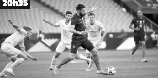
Football. Éliminatoires de la Coupe du Monde. Groupe D.