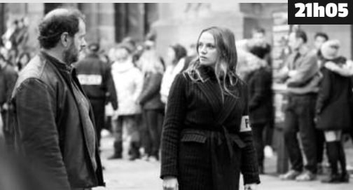
Sous un vent glacial, neuf élèves d'une école protestante disparaissent lors de la visite de la cathédrale.