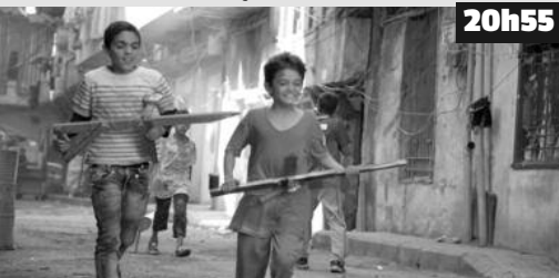
Alors qu'il purge une peine de cinq ans de prison, Zain veut tenter un procès à ses parents pour l'avoir mis au monde.