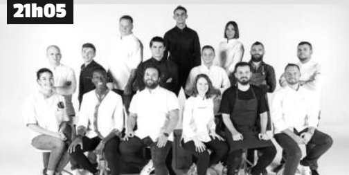
Huit candidats doivent reproduire à l'identique une assiette gastronomique composée par Glenn Viel.