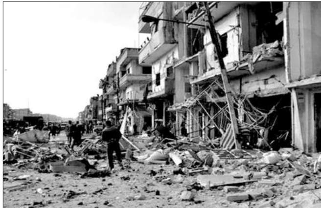
tures en Syrie et jouer le jeu des groupes terroristes présents dans le pays", le ministère a réaffirmé la détermination du gouvernement syrien à libérer toutes les zones du pays aux mains des forces d'occupation, y compris les

La Syrie exige du Conseil de sécurité de l'ONU des mesures immédiates visant à mettre fin aux attaques américaines", a indiqué samedi un communiqué du ministère syrien des Affaires étrangères. Dans deux lettres identiques adressées au secrétaire général de l'ONU, Antonio Guterres, et au président du Conseil de sécurité, le pays dénonce une agression "flagrante" commise sous des "prétextes invoqués". Le ministère a de nouveau appelé le Conseil de sécurité à "assumer la responsabilité du maintien de la paix et de la sécurité, et à prendre des mesures immédiates pour empêcher son membre permanent de poursuivre son agression et ses crimes contre un Etat souverain et un membre fondateur de l'ONU", a souligné également le communiqué. Le ministère syrien des Affaires étrangères avait déjà fermement condamné les frappes américaines qui ont visé vendredi dernier des positions dans la province de Deir ez-Zor, près de la frontière irakienne. Selon le ministère des Affaires étrangères syrien, l'attaque "sape la légitimité internationale dans la résolution de la crise syrienne". Soulignant que de telles attaques "ne feront que semer le chaos, détruire les infrastructures