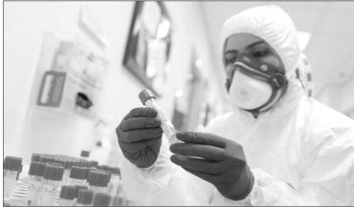
barrières, seuls moyens, dans l'état actuel de l'évolution de la situation épidémiologique de combattre le virus, avant que la campagne de vaccination ne couvre la majorité de la population.

Expliquant la manière dont ce nouveau variant pouvait s'introduire en Algérie, le ministre ajoute : « Il ne faut pas oublier que parmi les 1 000 Algériens, qui viennent d'Europe, figurent parmi eux ceux venant d'Angleterre, via Paris. Je citerai un autre exemple : avant le match CRB contre une équipe sud-africaine qui devait se jouer à Alger, deux représentants du club africain sont venus deux semaines auparavant pour préparer le séjour d'une délégation de 50 personnes qui devait être logée dans un hôtel qui continuait à accueillir des clients. Ces deux représentants sud-africains sont venus depuis Doha. Ils sont rentrés comme tout le monde. » Cependant, les spécialistes sont unanimes quant à la nécessité de respecter les gestes