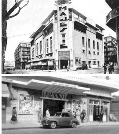
Les anciens cinémas d'Algier