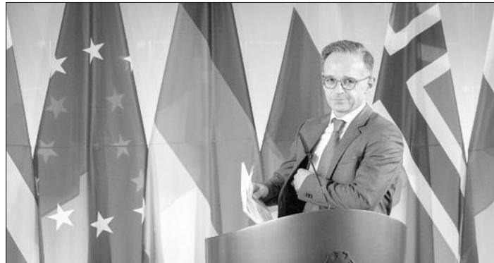
connus notamment par Moscou. Dénonçant violences et tortures de la part des forces de l'ordre, l'opposition réclame le départ de Loukachenko, la libération des protestataires détenus et l'organisation d'une nouvelle élection présidentielle.

En août 2020, un vaste mouvement de contestation a débuté en Biélorussie après l'annonce officielle de la réélection du Président Alexandre Loukachenko à son poste qu'il occupe depuis 1994. Les résultats de la présidentielle sont rejetés par l'opposition ainsi que par l'Union européenne mais re-