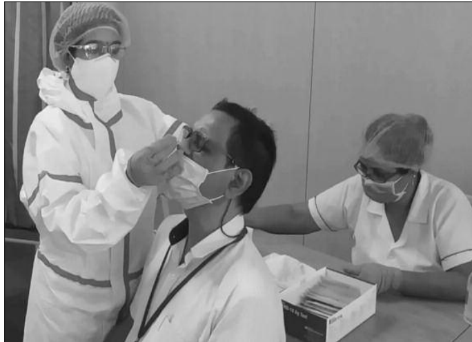
Le communiqué annonce aussi « l'ouverture progressive et contrôlée des stations thermales et des centres de thalassothérapie, à l'exception des bains collectifs ». Cette reconduction intervient 15 jours après l'allègement du couvre-feu de 22H au lieu de 20H à 05H du matin. Une mesure d'abord prise par Jijel, M'Sila et Alger avant sa généralisation aux 19 wilayas concernées. R.N

Les restaurants et les cafés ne sont plus limités à la vente à emporter. Leurs clients pourront de nouveau s'attabler. Les hôtels sont également autorisés à rouvrir leurs portes sans être autorisés à organiser des fêtes ou des mariages.