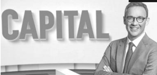
Acheter et vendre d'occasion, une vraie chance pour notre porte-monnaie et pour la planète ?