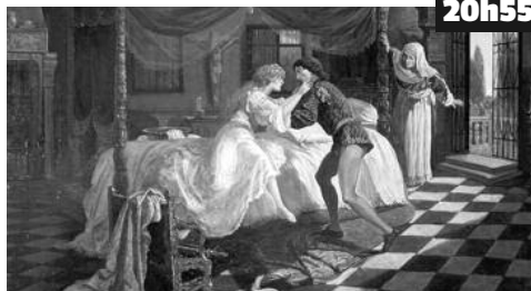
Les Montaigu et les Capulet, deux richissimes familles rivales, se livrent à une guerre sans merci.