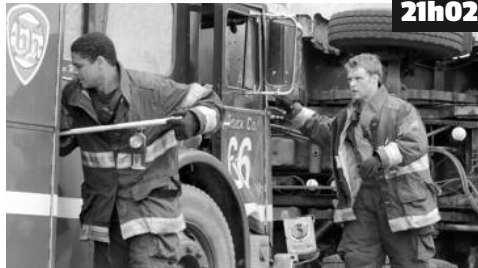
Stella apprend par le Dr Charles que son ami, Grant, instable psychologiquement, a quitté l'hôpital.