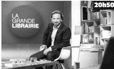
Des auteurs racontent leur œuvre et dévoilent leurs secrets d'écriture.