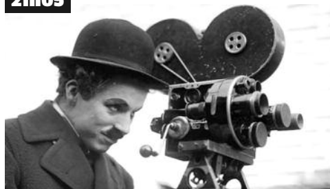
Depuis plus d'un siècle, tout le monde connaît et aime Charlie Chaplin.