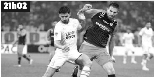
Éliminés de toutes les compétitions européennes, les Marseillais peuvent se consacrer entièrement aux joutes nationales.