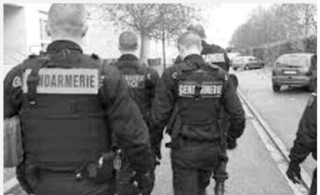
Le nord-est de Paris est gangrené par le trafic de drogues dures. Ce territoire est devenu une zone de non-droit.