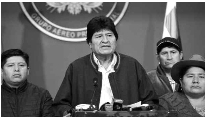
Chaos et incertitude, réunion de l'OEA sur la Bolivie

"Après avoir pillé et tenté de mettre le feu à ma maison à Villa Victoria, des groupes vandales des putschistes Carlos Mesa et Luis Fernando Camacho ont fait irruption chez moi dans le quartier de Magisterio à Cochabamba. Je suis très reconnaissant à mes voisins qui ont arrêté ces raids", a twitté M. Morales, en référence notamment au candidat d'opposition qui réclamait un second tour à l'élection présidentielle.