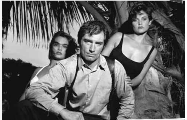
James Bond doit organiser la fuite à l'Ouest du général Koskov.