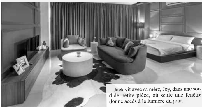
Jack vit avec sa mère, Joy, dans une sordide petite pièce, où seule une fenêtre donne accès à la lumière du jour.