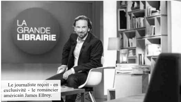
Le journaliste reçoit - en exclusivité - le romancier américain James Ellroy.