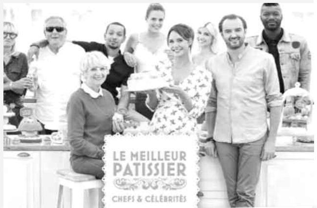
Candidats doivent transformer un simple bouquet de roses en un gâteau ayant la saveur et le visuel de la fleur.