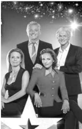
Chaque candidat dispose de deux minutes pour effectuer une prestation