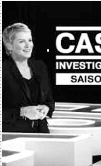
Qui profite de nos impôts ?