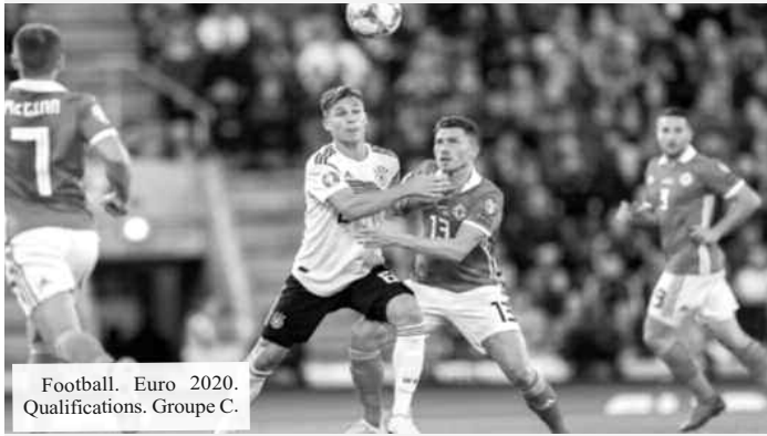
Football. Euro 2020. Qualifications. Groupe C.