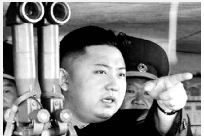
Entre Pyongyang et Washington, l'escalade des tensions continue.