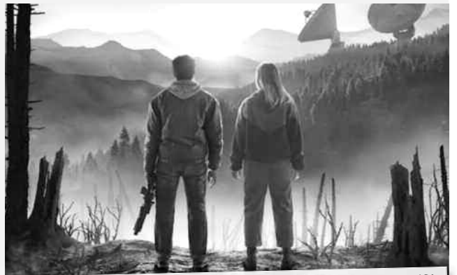
Catherine parvient à repérer le signal d'un vaisseau qui a atterri près de l'Observatoire.