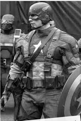
Alors que les Etats-Unis sont entrés dans la Seconde Guerre mondiale, le jeune Steve Rogers veut s'engager.