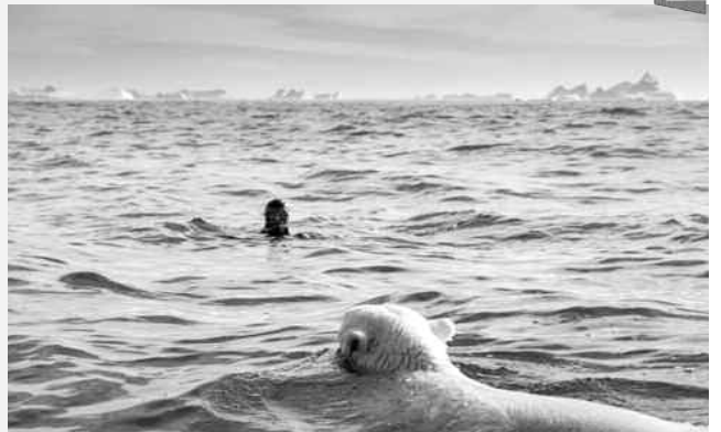
Une tempête surprend une dizaine d'invités qui se retrouve isolé au sommet d'un éperon rocheux.