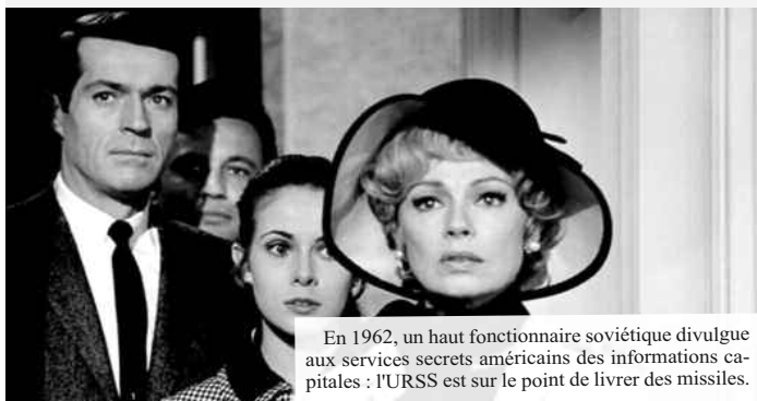
En 1962, un haut fonctionnaire soviétique divulgue aux services secrets américains des informations capitales : l'URSS est sur le point de livrer des missiles.