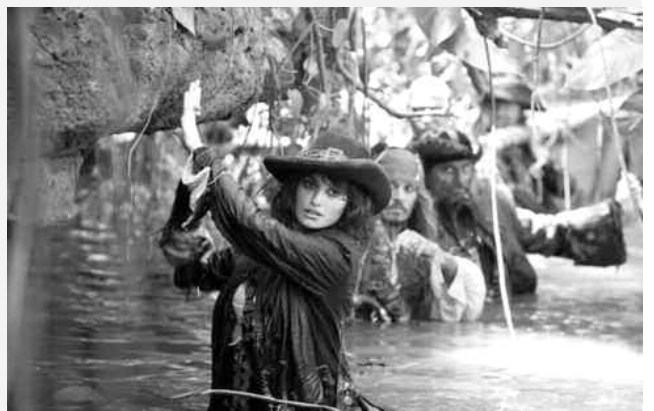
Jack Sparrow est à Londres. Il tente de sauver Gibbs, son second, qui a été arrêté.